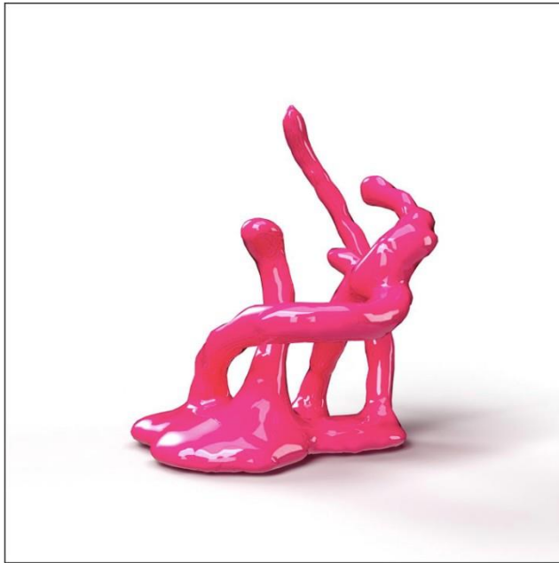
LOVE #0593 VoV twodee NFT by MoBen

Maurice Benayoun est un artiste contemporain pionnier des nouveaux médias, commissaire d'exposition et théoricien, basé entre Paris et Hong Kong. Son travail fait appel à divers médias, notamment (et souvent en les combinant) la vidéo, l'infographie, la réalité virtuelle immersive, Internet, la performance, l'EEG, l'impression 3D, les installations d'art médiatique urbain à grande échelle et les expositions interactives. Souvent conceptuel, le travail de Maurice Benayoun constitue une investigation critique des mutations de la société contemporaine induites par les technologies émergentes ou récemment adoptées.