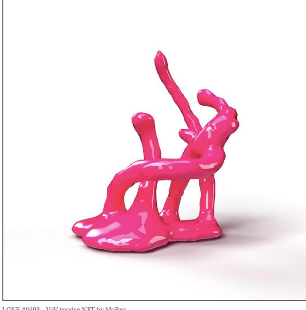
LOVE #0593 VoV twodee NFT by MoBen

Maurice Benayoun suvremeni je umjetnik, pionir novih medija, kustos i teoretičar, sa sjedištem između Pariza i Hong Konga. Njegov rad koristi razne medije, uključujući (i često kombinirajući) video, računalnu grafiku, impresivnu virtualnu stvarnost, internet, performanse, EEG, 3D ispis, urbane medijske umjetničke instalacije i velike interaktivne izložbe. Često konceptualno, djelo Mauricea Benayouna predstavlja kritičko istraživanje promjena u suvremenom društvu koje su donijele nove ili nedavno usvojene tehnologije.